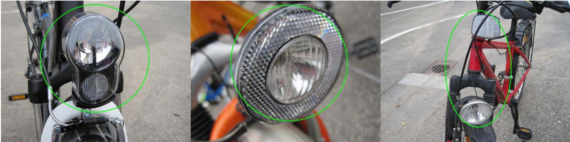
Fahrradlampen und Reflektoren sehen so aus..